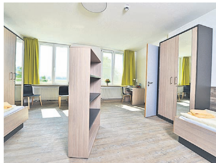
Die Klinik für Psychosomatik und Psychotherapie verfügt über komfortable, geräumige Zimmer.